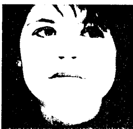
A.P. Komen: Face Shopping, 1994

Veel van het werk op The Second mag dan 'kunst over kunst' lijken... je wordt er als toeschouwer ook veel actiever bij betrokken dan bij 'traditionele' kunst. Het is dan ook een goede vondst van de organisatoren om The Second te openen met I/ Eve van Bill Spinhoven, een van de mooiste 'openbare kunstwerken' in Amsterdam. Het is een video van een oog, een woedend oog, dat dreigend om zich heen kijkt en als een bewakingscamera alles in de gaten lijkt te houden. Het ziet er zelfs zo levensecht uit dat je als toeschouwer, net als bij Zwanikken, op je hoede raakt, en het duurt dan ook even voordat je beseft dat het oog van Spinhoven niet kijkt en al helemaal niets ziet... een machteloos doelwit voor de blikken van de toeschouwer.