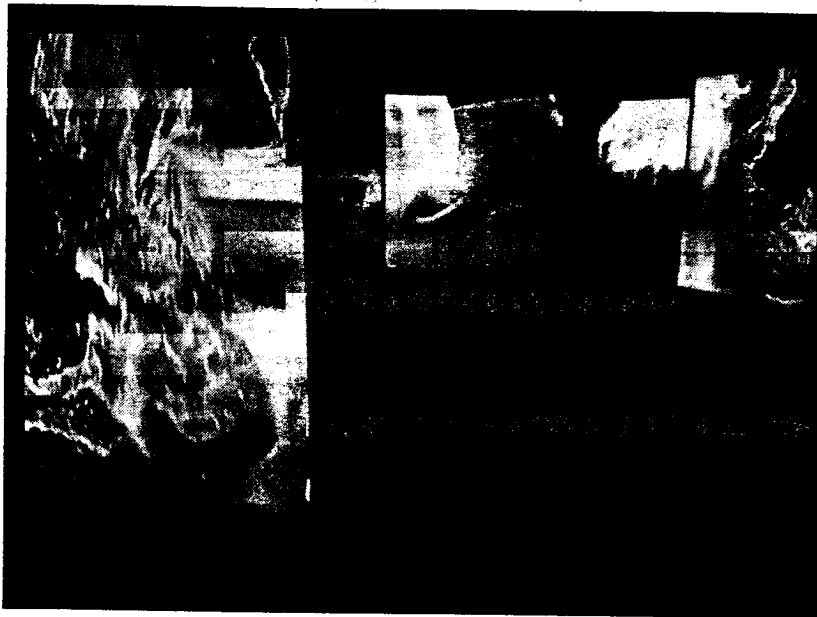
Eldrúnir eftir Steinu Vasulka.

Ef frá er talin yfirlitssýning á Kjarvalsstöðum á feminískri skjálist á síðasta ári hefur þessi listgrein ekki verið áberandi á sýningum hér á landi. Fyrir fáum árum sýndi Sjónvarpið þó þáttaröð um skjálist og í kjölfarið hefur einstaka listamaður sýnt myndbandaverk, ýmist sem hluta af innsetningu eða gerningi ellegar í formi stuttmynda. Enginn hefur þó gengið jafn langt og Steina Vasulka í því að skapa sérstæðar og alltumlykjandi innsetningar, byggðar á margrása samspili myndar og hljóma, en Steina, sem hefur búið lengi í Bandaríkjunum, telst meðal frumkvöðla í þessari listgrein líkt og Gene Youngblood staðfestir í sýningarskrá. Fyrir tveimur árum tók Steina þátt í sam-sýningu í Listasafni Íslands og sýndi þar eftirminnlegt verk