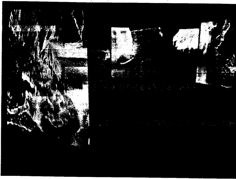
Eldrúnir eftir Steinu Vasulka.

Ef frá er talin yfirlitssýning á Kjarvalsstöðum á feminískri skjálist á síðasta ári hefur þessi listgrein ekki verið áberandi á sýningum hér á landi. Fyrir fáum árum sýndi Sjónvarpið þó þáttaröð um skjálist og í kjölfarið hefur einstaka listamaður sýnt myndbandaverk, ýmist sem hluta af innsetningu eða gerningi ellegar í formi stuttmynda. Enginn hefur þó gengið jafn langt og Steina Vasulka í því að skapa sérstæðar og alltumykjandi innsetningar, byggðar á margrása samspili myndar og hljóma, en Steina, sem hefur búið lengi í Bandaríkjunum, telst meðal frumkvöðla í þessari listgrein líkt og Gene Youngblood staðfestir í sýningarskrá. Fyrir tveimur árum tók Steina þátt í sam-sýningu í Listasafni Íslands og sýndi þar eftirminnlegt verk