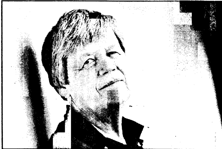
STEINA Vasulka myndlistarmaður.